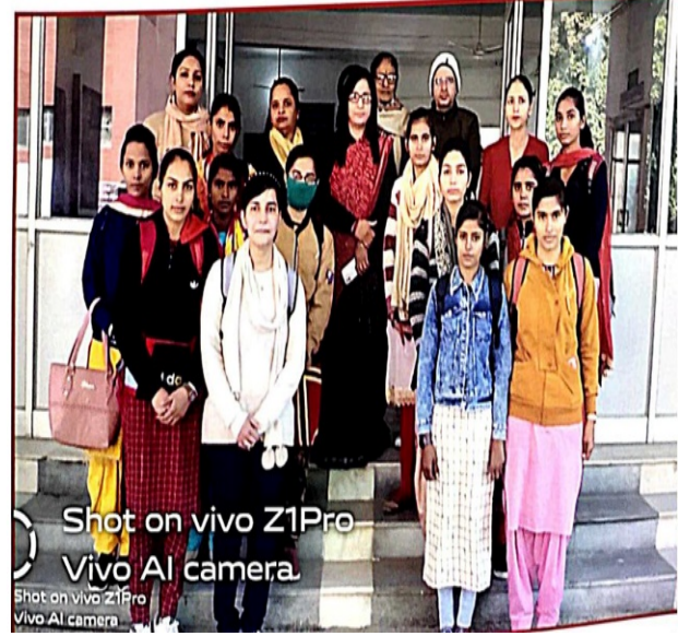
Shot on vivo Z1Pro Vivo AI camera

आयोजक सूचना 11-11-2020 महाविद्यालय के सभी विद्यार्थियों को सूचित किया जाता है कि हिन्दी साहित्य परिषद की ओर से दिनांक 17-11-2020 को आयोजित किया जाएगा (Online Mode) के विद्यार्थियों के विषय निम्नलिखित हैं:- 1. वैयक्तिक और विज्ञान। 2. समाज का महत्व। H. Mahajan विभागाध्यक्ष