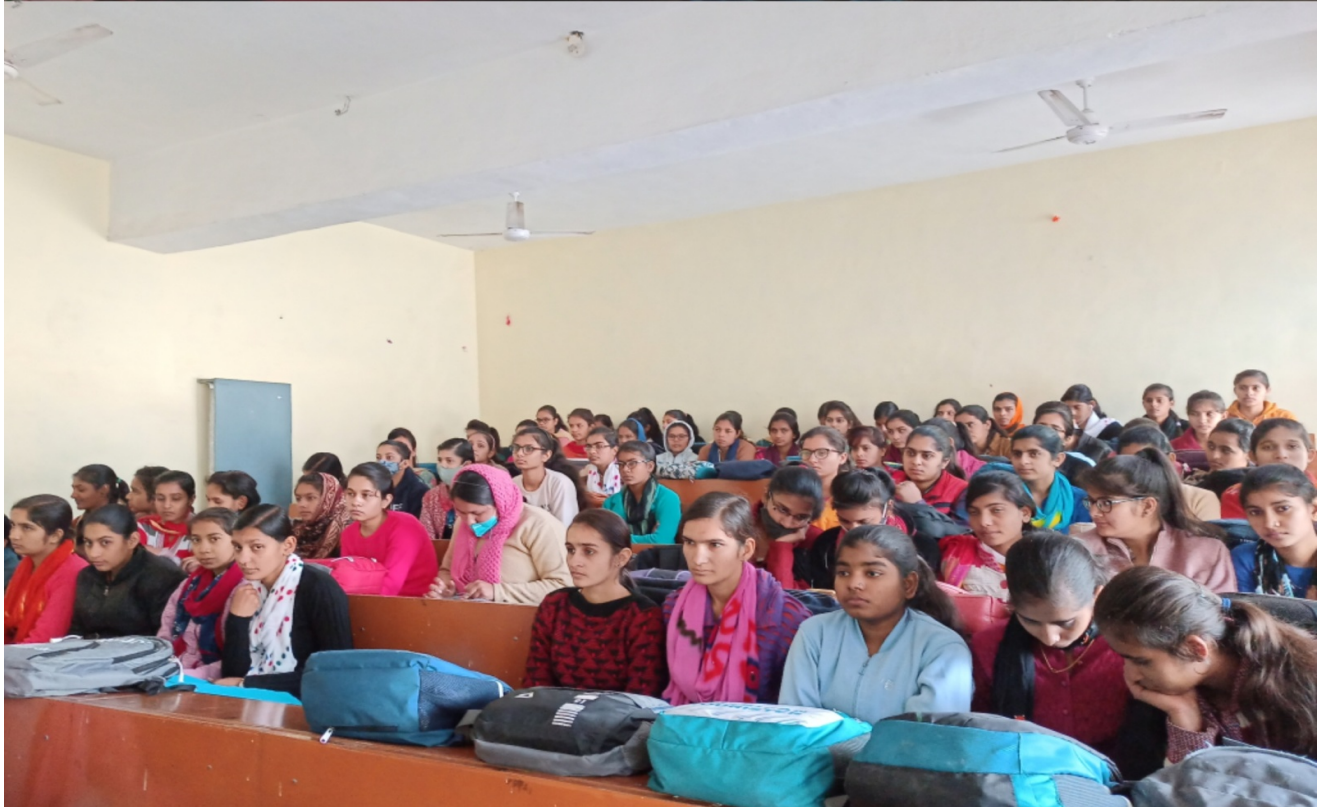
“Online lecture on Nutrition Gyan”