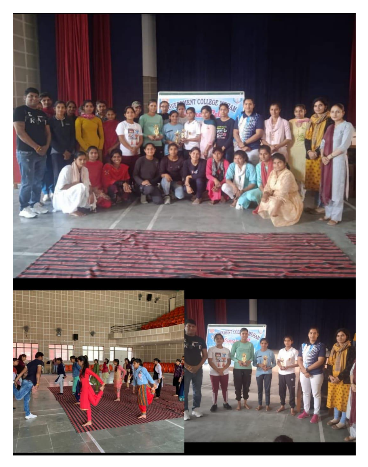
SELF DEFENCE TRAINING BY WOMEN CELL