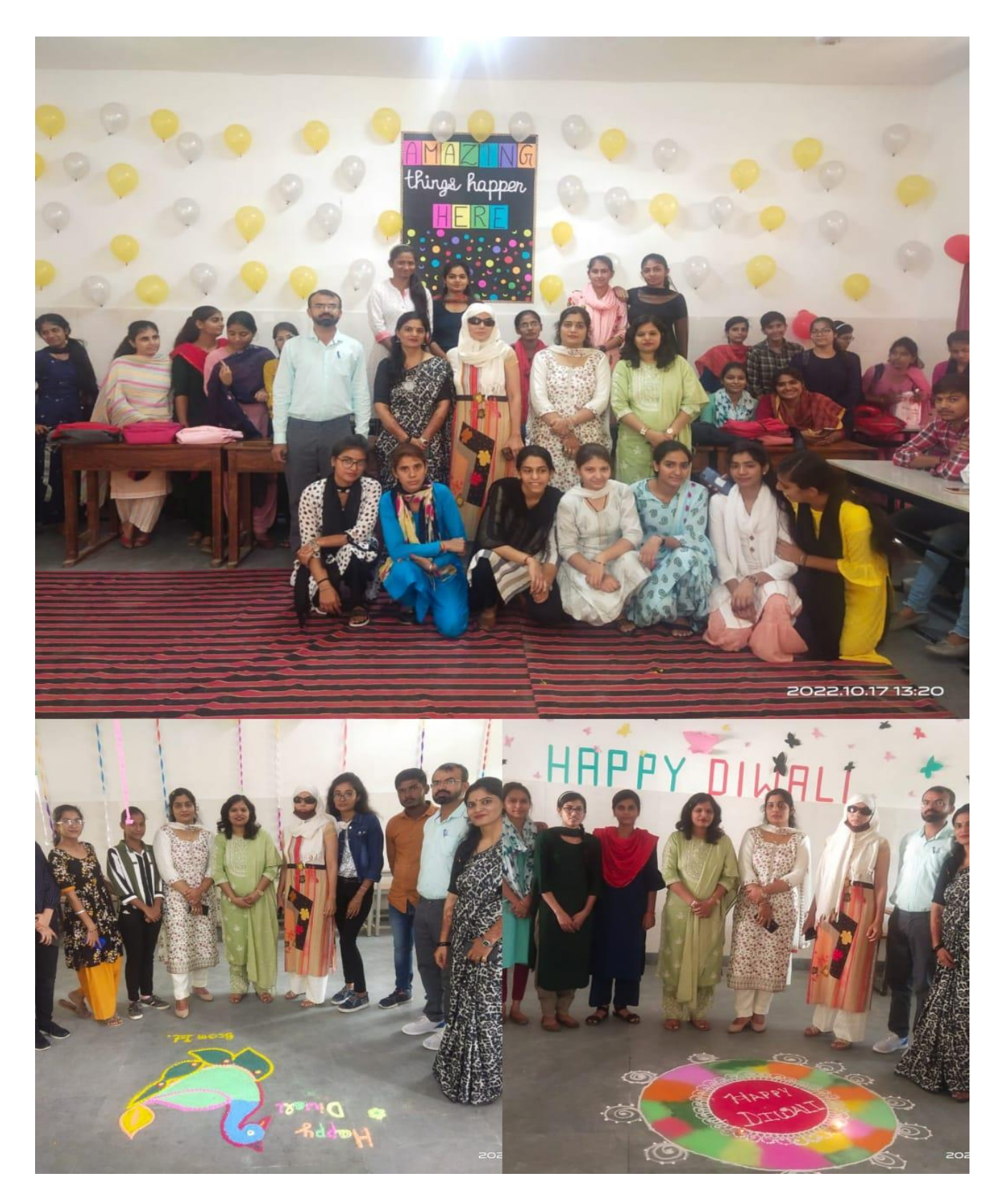
RANGOLI AND ROOM DECORATION BY COMMERCE DEPARTMENT