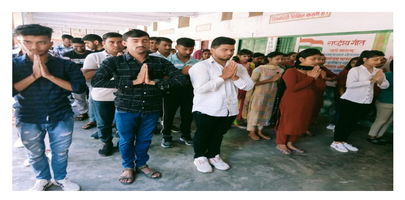
YOGA PRACTISES BY NSS STUDENTS