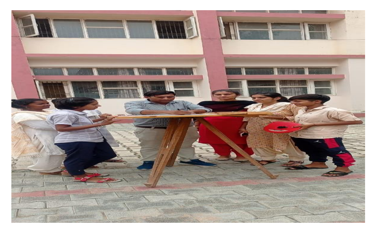
FIELD WORK BY GEOGRAPHY DEPARTMENT