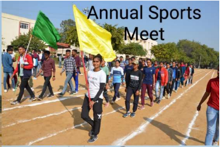
Annual Sports Meet