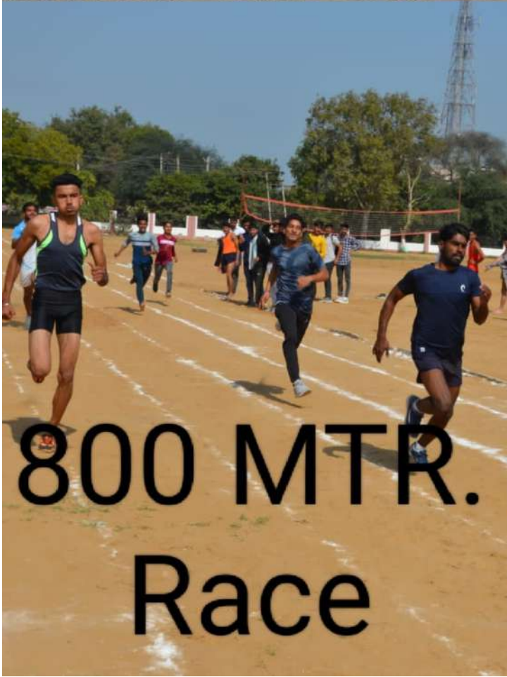
800 MTR. Race