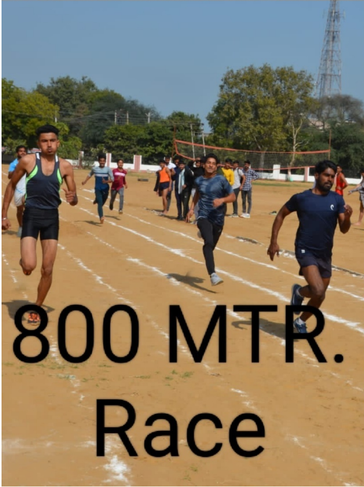
800 MTR. Race