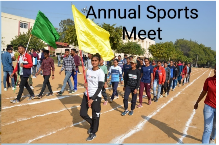
Annual Sports Meet