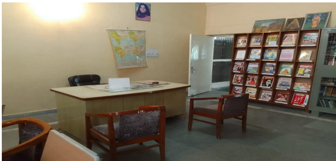
JOURNAL AND MAGAZINE SECTION