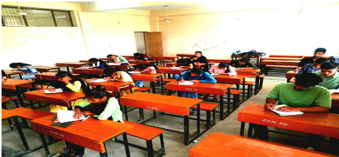
ESSAY WRITING COMPETITION BY HINDI DEPARTMENT